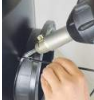
TRIAC AT: сварка трубы с помощью насадки быстрой сварки