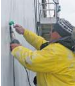
При использовании надежного TRIAC S профессионал получает великолепные результаты