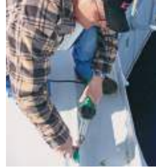
TRIAC AT: профессиональный ручной аппарат для работы на крыше