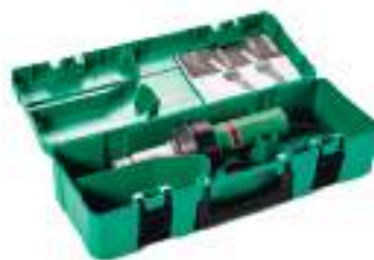
Практичный кейс, где есть место для всего необходимого, входит в комплект поставки