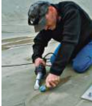
Сварка стыков при помощи TRIAC AT и щелевой насадки