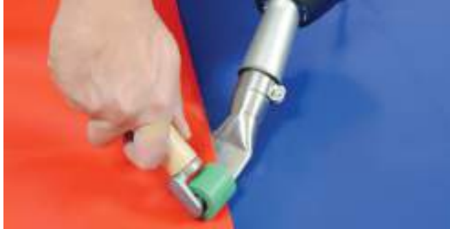
Сварка технических тканей ручным аппаратом TRIAC AT с цифровым управлением. Контроль температуры сварки, регулируемый расход воздуха